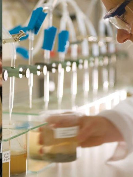
그로닝겐 대학 B.L. Feringa 교수 (2016년 노벨화학상 수상)